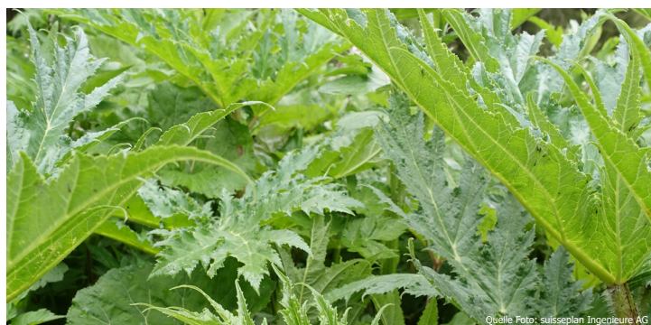
Der Riesenbärenklau kann zu Verbrennungen auf der Haut führen.