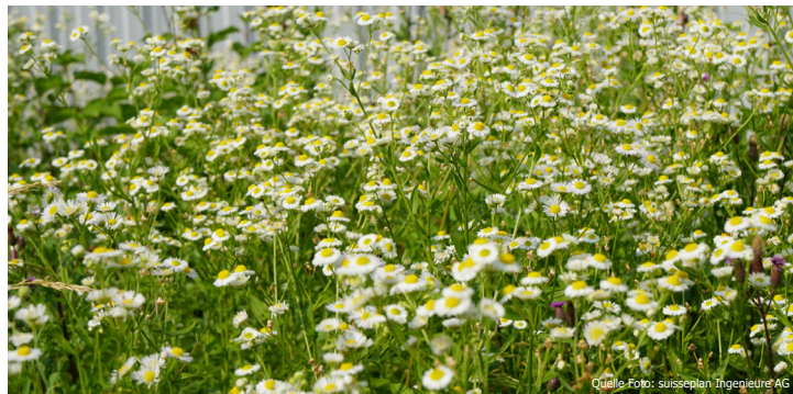
Eine stark mit einjährigem Berufkraut befallene Fläche.