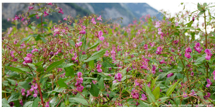
Das drüsige Springkraut verdrängt einheimische Pflanzenarten.

Gemäss Direktzahlungsverordnung (DZV, Art. 58) ist die Bekämpfung invasiver Neophyten auf Biodiversitätsförderflächen (BFF) Pflicht. Insbesondere ist deren Ausbreitung zu verhindern. Dabei ist zu beachten, dass bei extensiv und wenig intensiv genutzten Wiesen sowie Streueflächen ein Schnittzeitpunkt festgelegt ist, der für die Neophytenbekämpfung zu spät ist. Nachfolgend ist erläutert, welche Möglichkeiten auf diesen Flächen bestehen, damit die invasiven Neophyten trotzdem erfolgreich bekämpft werden können.