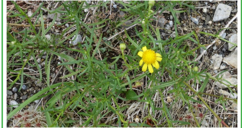
Südafrikanisches Greiskraut/ Senecio inaequidens

Höhe: 30-100 cm Blütezeit: Juni bis August Blüte: gelb, ca. 1.5-2.0 cm Blatt: alle Blätter fiederteilig Lebensform: zweijährige bis ausdauernde Pflanze