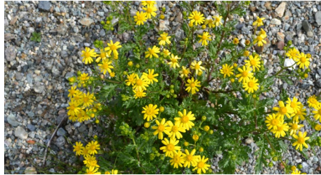
Jakobs Greiskraut/ Senecio jacobaea

Höhe: 15-60 cm Blütezeit: Juli bis September Blüte: gelb, ca. 2.0-3.0 cm Blatt: breitlanceolisch mit grossem Endabschnitt, obere Blätter fiederteilig Lebensform: wenigjährige Pflanze