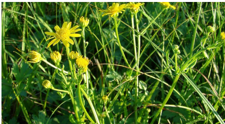
Wasser-Greiskraut/ Senecio aquaticus

Innerhalb von Siedlungen stellt das nicht heimische Südafrikanische Greiskraut, ein invasiver Neophyt, eine grosse Herausforderung dar. Dieses Greiskraut verbreitet sich explosionsartig entlang von Strassen und Bahnlinien sowie auf Ruderalflächen. Insbesondere auch Rebberge mit offenen Bodenstellen sind vor einer möglichen Ausbreitung dieses Greiskrauts zu schützen.